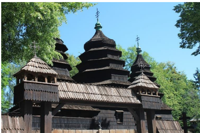
Træbygning ved frilandsmuseum

“På den træbeklædte skråning nord for Lychakivsky-kirkegården finder du det fine frilandsmuseum, Shevchenkivskyi Hai. Her kan du opleve bjælkehuse, gårde og ladebygninger, som er hentet fra hele det vestlige Ukraine, og genopført i de charmerende omgivelser. I dag findes der over 100 forskellige bygninger i den store park – flere af dem er åbne for publikum.”