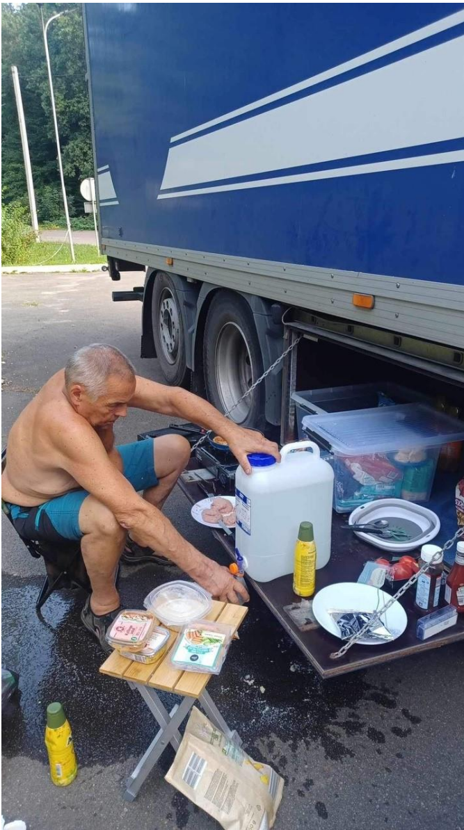
Mad ved grænsen

Inden vi nåede det hjemlige skulle vi lige forbi Tønder og Rødekro og laste masser af gode sager. 6 døgn efter vi tog af sted var vi hjemme igen. Når man tager i betragtning at vi var turister i et døgn, så er det vist godt klaret at køre 3.959 km på 5 døgn med 1 chauffør.