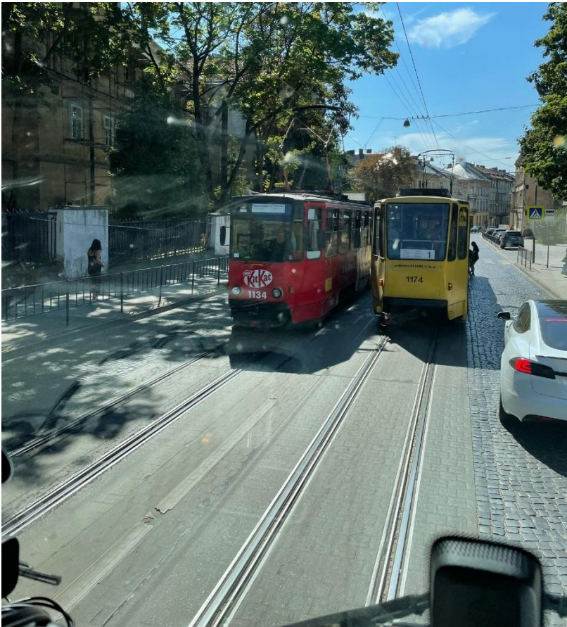
Trængsel i Lviv

Eneste vej væk fra området og mod grænsen var gennem centrum af Lviv. Her kunne jeg nyde de smukke bygninger fra passagersædet.