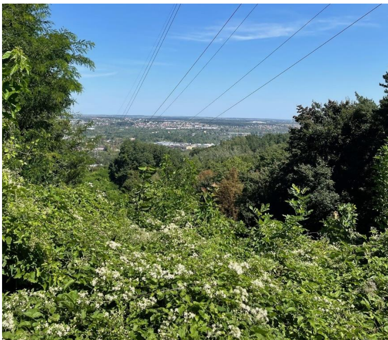
Udsigt ved frilandsmuseum

Stien var smal så vi gik i gåsegang. Arnbjørn var flink til at berette om de stejle skråninger vi kunne se ned af, alt mens jeg og min tro følgesvend Højdeskræk, med rystende ben prøvede at holde trit.