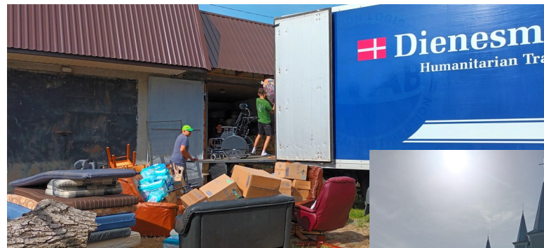
Aflæsning ved en bygning ved siden af kirken

Den evangeliske-kristne baptist kirke i Dunaivtsi. Bygningen til venstre er kontor og værelsesbygning